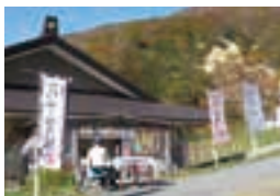
仙人沢売店(大鳥居わき) Senninzawa restaurant

Take a short break at the souvenir shops