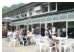
米の粉の滝ドライブイン

Komenoko-no-taki roadside restaurant 地元で人気のおいしいラーメンや早朝の立ち食いコーナーなど、旬の素材を活かしたメニューが豊富。季節限定メニューもあります。