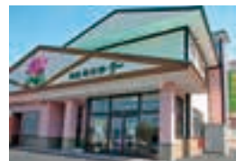
産直あさひ・グー

月山ワインのワイナリーを併設し、月山ワインの商品は全て揃い、テイastingも可能。山ぶどうシャーベットやソフトも人気。そば処で手打ちそばをご賞味あれ。☎ 0235-53-3411