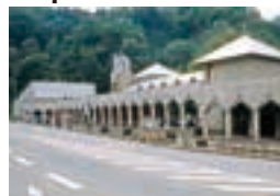
道の駅「月山」月山あさひ博物村

Gassan Rest Area Gassan-Asahi Hakubutsu Mura