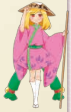
あさひ観光協会イメージキャラクター 「カタクリ姫」

“Rokujurigoe Kaido,” an ancient road connecting the Shonai plain and the inland area is said to have opened about 1200 years ago. Rokujurigoe Kaido was a precipitous mountain road, from the Tsuruoka central area to Yamagata city passing over Matsune, Juo-toge, Oami, Tamugimata, Yudonosan and Oguki-toge, and going through Shizu, Hondoji and Sagae. After the Meiji era, this road was not used so much as a new road was opened. But today “Rokujurigoe Kaido” is still rich with historic remains.